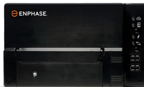
Enphase Envoy en de Enphase micro-omvormer

De opties voor productiemeting en verbruiksbeheer maken de Envoy-S hét platform voor totaal energiebeheer. Het is nu al klaar voor de eventuele energie opslag in de toekomst met een Enphase AC Battery™.